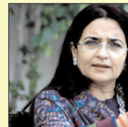
जिसकी मुख्यमंत्री ने घोषणा की है। उन्होंने कहा कि यह पहला आईएमटी है, जो तोशाम जैसे ग्रामीण क्षेत्र में मुख्यमंत्री ने दिया है, इसके लिए वे मुख्यमंत्री की बहुत-बहुत आभारी हैं। श्रुति चौधरी द्वारा तोशाम इलाके के विकास के लिए निरंतर प्रयास किया जा रहे हैं। इसी समय-समय पर किसानों और युवाओं की समस्याओं को उठाना है पूर्व मुख्यमंत्री स्वर्गीय चौधरी बंसीलाल के सपनों को साकार करने में कोई कसर नहीं छोड़ रही। बंसी लाल जी के कार्यकाल में बनाई गई सभी नहरों और नालों जीर्णोद्धार किया जा रहा है, जिससे क्षेत्र की कृषि व्यवस्था को आधुनिक बनाया जा रहा है। श्रुति चौधरी द्वारा क्षेत्र में रोजगार की मांग को लेकर किए गए प्रयासों का ही परिणाम है कि ही मुख्यमंत्री

ने तोशाम को आईएमटी का तोहफा दिया है। वहीं दूसरी ओर सिंचाई एवं जल संसाधन तथा महिला एवं बाल विकास मंत्री श्रुति चौधरी ने भी तोशाम में आईएमटी देने पर मुख्यमंत्री श्री नायब सिंह सैनी का आभार जताया है। उन्होंने कहा है कि इससे तोशाम क्षेत्र के विकास में नए द्वार खुलेंगे। क्षेत्र का औद्योगिक विकास होगा। युवाओं का भविष्य उज्वल होगा। भिवानी में मेडिकल कॉलेज की शुरुआत होने से क्षेत्र की चिकित्सा व्यवस्था में भूतपूर्व सुधार हुआ है। क्षेत्र के लोगों को इलाज के लिए दूसरे क्षेत्रों में नहीं भटकना पड़ रहा है। सभी सुविधाएं सरकार जल्द पूरा करने जा रही हैं। नहरों की समान बटवारा होने से सभी क्षेत्रों के किसानों को समय पर नहरी पानी उपलब्ध हो पा रहा है। नहरों की मरम्मत और निम्णण के कार्य तीव्र गति से हो रहा है। सरकार हर वर्ग तक सुविधा पहुंचाकर क्षेत्र के भलापे प्रगति के द्वार खोल रही है। भाजपा सरकार में सब का साथ ,सबका विकास का लक्ष्य साकार किया जा रहा है।